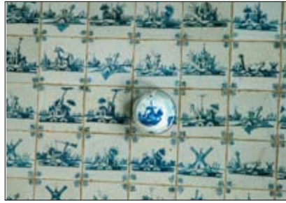
Bezprzewodowa czujka SSP wkomponowana w tło mozaiki w Pałacu w Nieborowie

Praktyczną pomocą w znajdowaniu rozwiązań podnoszących jakość bezpieczeństwa służą muzeom dwa uzupełniające się działy specjalistyczne NIMOZ: Dział Analiz Kryminalnych oraz Dział Metod i Technik Ochronnych (MITO). Ten ostatni ma ogromnie rozbudowany zakres zadań – ich prezentację zaczniemy od bezpłatnej działalności konsultacyjno-doradczej dla muzeów. Dotyczy ona takich spraw jak organizacja ochrony fizycznej wystaw stałych i czasowych – opracowania dokumentacji organizacyjno-ochronnej (planów ochrony, instrukcji, regulaminów, a także doku-