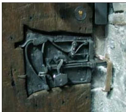
Zabezpieczenia mechaniczne – połączenie nowego zamka i starego zamknięcia

Baza zawiera, oprócz danych identyfikacyjno-organizacyjnych (dane rejestrowe, charakterystyka), informacje o ochronie fizycznej, a także użytej technice ochronnej, np. przy zabezpieczeniach mechanicznych jest to dokumentacja o ich rodzaju (kraty, ściany, wkładki, zamki, klucze...). W przypadku „włamaniówki”: jaka jest centrala alarmowa, kiedy system został założony,