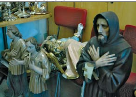
Zabytki do identyfikacji zatrzymane u paserów przez policję