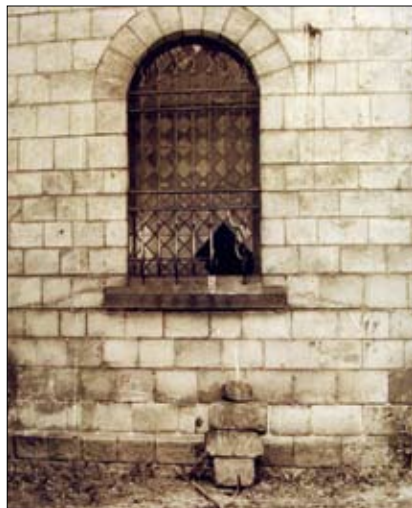
Z protokołu z oględzin miejsca włamania

wach o przestępstwa na szkodę dóbr kultury. Ocenia się w nich okoliczności przestępstw, modus operandi sprawców, błędy w systemach zabezpieczeń oraz zaniedbania w ochronie. Często bowiem jest tak, że zawiodły procedury, nie było odpowiedniej reakcji na sygnał lub zdarzenie. Wnioski wspomagają prewencję – planowanie i doskonalenie ochrony oraz systemów zabezpieczeń w muzeach. Analizowano np. kradzieże w bibliotekach z zasobem narodowego zbioru bibliotecznego. Sprawcy posługiwali się np. nie swoimi kartami bibliotecznymi. Czyli nie sprawdzano kart z dowodami tożsamości, nie oglądano stanu fizycznego oddawanych pozycji (np. złodziej latami kradł fragmenty książek).