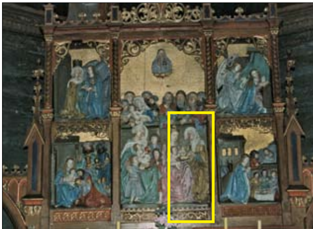
Tryptyk ołtarza z kościółka św. Anny w Olesnie i odnaleziona drewniana rzeźba