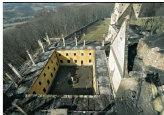
Efekt pożaru dachu w zespole klasztornym w Alwerni w 2011 r.

Na początku lat 90. zakres działania ośrodka rozszerzono i do tematyki muzealnej dodano ochronę zabytków nieruchomości. Doszły ważne aspekty techniczne: ochrona przed pożarami i przestępczością. Wewnętrzna inicjatywa zespołu było wplecenie w te specjalizacje tematyki zabezpieczeń mechanicznych i organizacji ochrony fizycznej. W sumie powstawało kompleksowe, systemowe podejście –