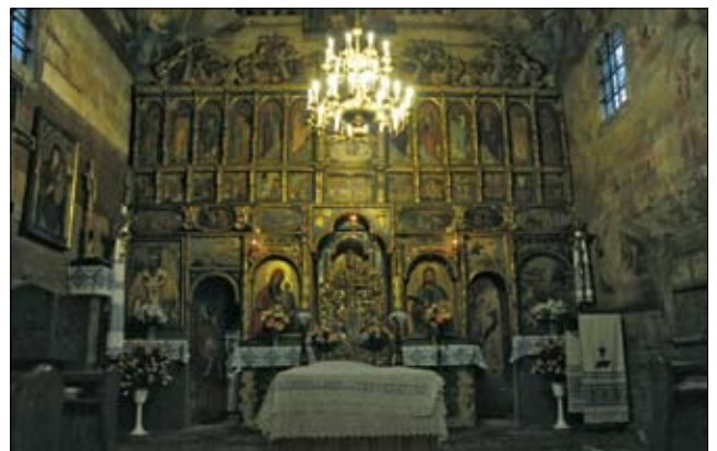
Wnętrze drewnianej cerkwi zabezpieczone systemem bardzo wczesnej detekcji dymu VESDA