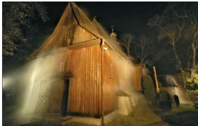
System gaszenia mgłą wodną FOG zainstalowany w drewnianym kościele w Modlnicy

mentacji zabezpieczeń technicznych. Dotyczy także doboru, rozmieszczenia i oceny urządzeń zabezpieczających. Dział również podpowiada muzeom przepisy, normy i wydawnictwa mogące pomóc w rozwiązywaniu zadań ochronnych. Zajmuje się ponadto organizowaniem zabezpieczenia transportu zbiorów.