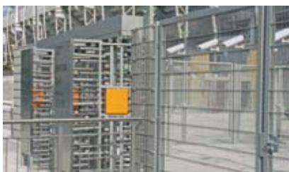
< Kamery przy kołowrotach