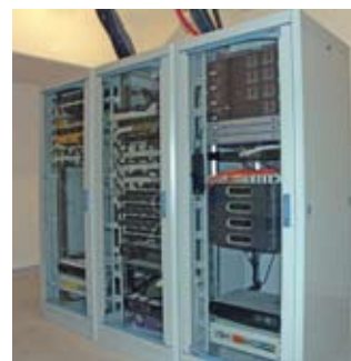
^ Jeden z węzłów dystrybucyjnych